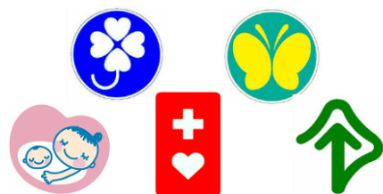
福祉に関するマークの一例