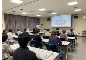
令和5年9月 日本血液製剤機構見学