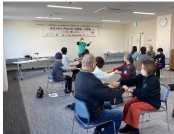
令和5年11月 レクリエーション活動