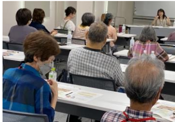
令和5年7月 まちおこし協隊と手話言語条例

ボランティア同士の交流も行いながら、本研修会も18回開催し、新たなボランティア活動の再開に向けて準備を進めています。