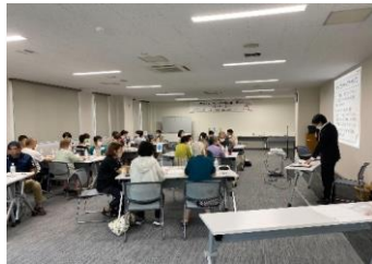
令和5年8月 災害エスノグラフィを学ぶ