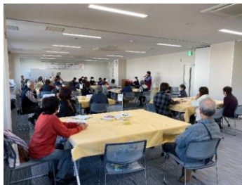
令和5年10月 トランペット演奏