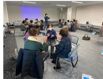
令和5年12月 「コグニサイズ」体験