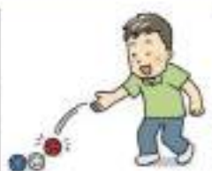
おこなう種目② ポッチャ