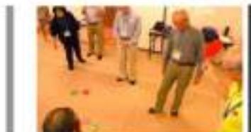
おこなう種目④ カーリンコン

当日のスケジュール 10時受付開始し、その後準備運動としてウォーキングを行います。本格的な運動に入ります。