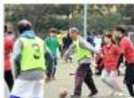
おこなう種目① ウォーキングサッカー