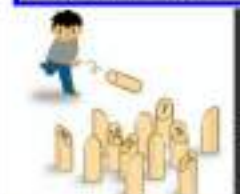
おこなう種目③ モルック

●申込先● 北広島市にし高齢者支援センター 住所：大曲南ヶ丘1丁目1-5 電話：378-3922 メール：w-care-c@suite.plala.or.jp 営業時間：8:50～17:15