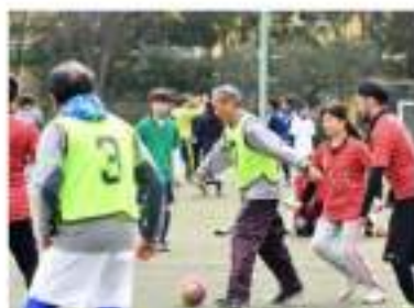
おこなう種目③ ウォーキングサッカー