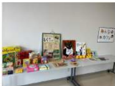
好きなゲームで遊べるよ☺

飲み物を飲んでゆったり過ごしたり、みんなで ゲームで遊んだり、 自分の好きな過ごし方で のんびり過ごせる居場所です。