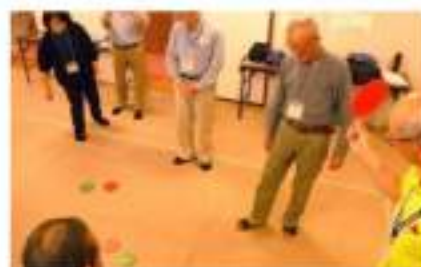
おこなう種目④ カーリンコン

当日のスケジュール 10時受付開始し、その後準備運動としてラジオ体操をおこない、本格的な活動に入ります。