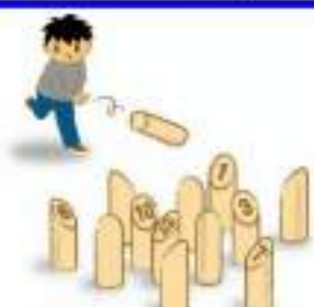
おこなう種目① モルック

●申込先● 北広島市にし高齢者支援センター 住所：大曲南ヶ丘1丁目1-5 電話：370-3922 メール：w-care-c@agate.plala.or.jp 営業時間：8:50～17:15