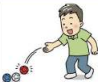
おこなう種目② ポッチャ