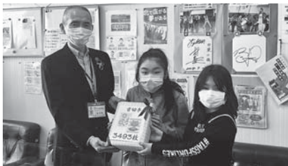
双葉小学校児童会