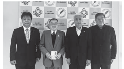
北海道宅地建物取引業協会札幌東支部